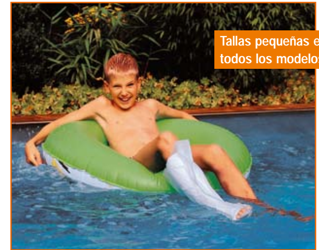
Tallas pequeñas en todos los modelos.

AquaProtect protege de forma eficaz los vendajes de brazos y piernas no sólo en la ducha y el baño, sino también en la piscina y al practicar deportes acuáticos.