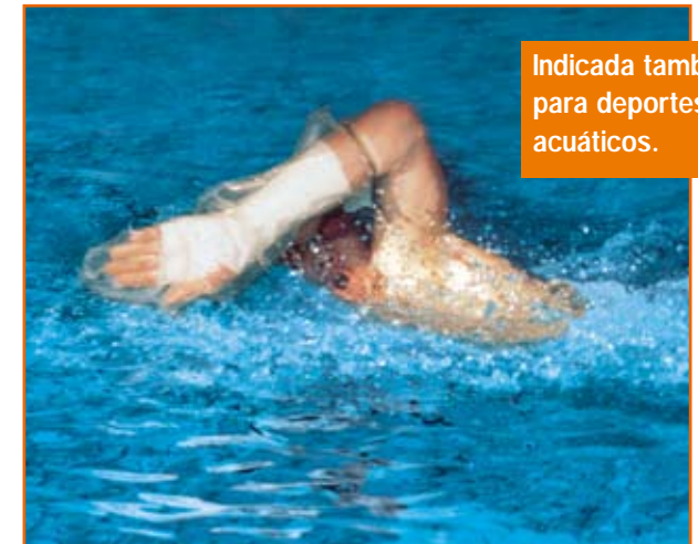
Indicada también para deportes acuáticos.

AquaProtect mantiene la impermeabilidad tanto si nada como si bucea.