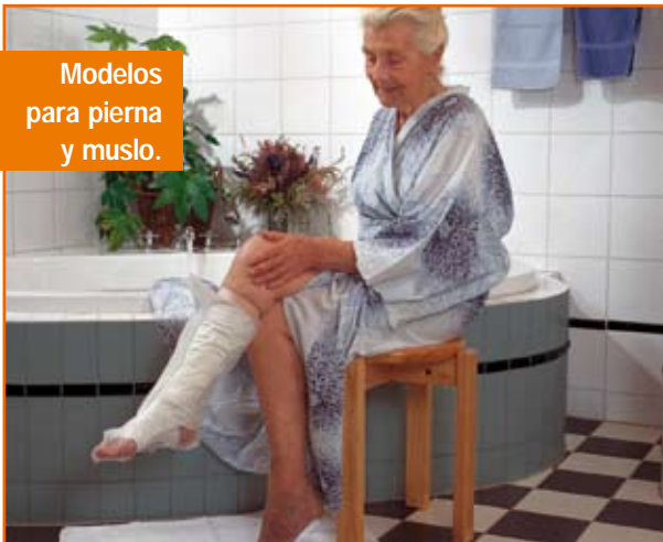
Modelos para pierna y muslo.

A partir de ahora podrá tomarse una ducha refrescante o un baño relajante sin preocuparse lo más mínimo. Tampoco deberá preocuparse a la hora de lavar los platos o fregar el suelo: cubriendo su vendaje con AquaProtect conseguirá una impermeabilidad total.